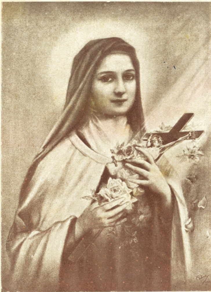
ŚW. TERESA OD DZIECIĄTKA JEZUS

Przełożony Misjonarzy djecezalnych Wandei